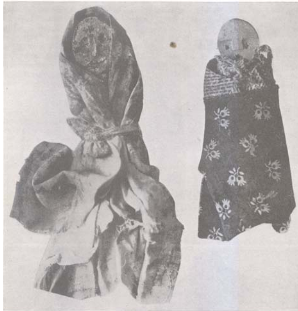
FIGURE 5. Figurines representing the dead.

Quant à ceux/celles qui ont une libido homosexuelle, ils/elles peuvent l'assumer sans crainte, ce qu'ils/elles ne se gênent pas pour faire.