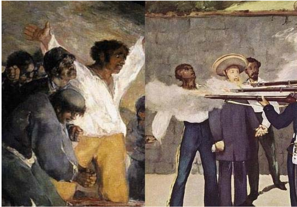
Goya et Manet Deux visions de la mort

évoquer au mieux ce qu'était et peut encore être la fonction sociale du chamanisme, la différence entre la façon de travailler des chamans et des chamanes (les 'femmes-shamans') et le rôle du masculin/féminin dans la pratique chamanique. Enfin, je pourrai revenir sur le sujet central au chamanisme : la mort.