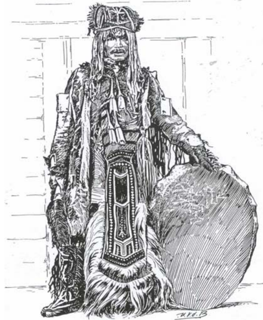
A TUNGUS SHAMAN IN CEREMONIAL DRESS.

l'inverse que je propose de faire : « Mettez vous dans un état tel que soyez capable de reconnaître une vision , et attendez que la vision d'un animal ou de tout autre phénomène naturel, s'impose à vous ». En d'autres termes, vous n'allez pas chercher 'vos' (déjà ce possessif est de trop!) animaux esprits, ce sont eux qui vous cherchent ou non. Comprenez aussi que vous n'êtes pas si important que cela pour eux et qu'ils risquent de vous solliciter avec discrétion. Si vous rejetez leurs timides avances, soyez sûrs qu'ils ne reviendront pas ! J'ai une assez grande expérience de personnes qui n'osent pas faire ce que les Esprits leurs demandent, et qui ont ensuite besoin d'un long travail pour récupérer après cette erreur.